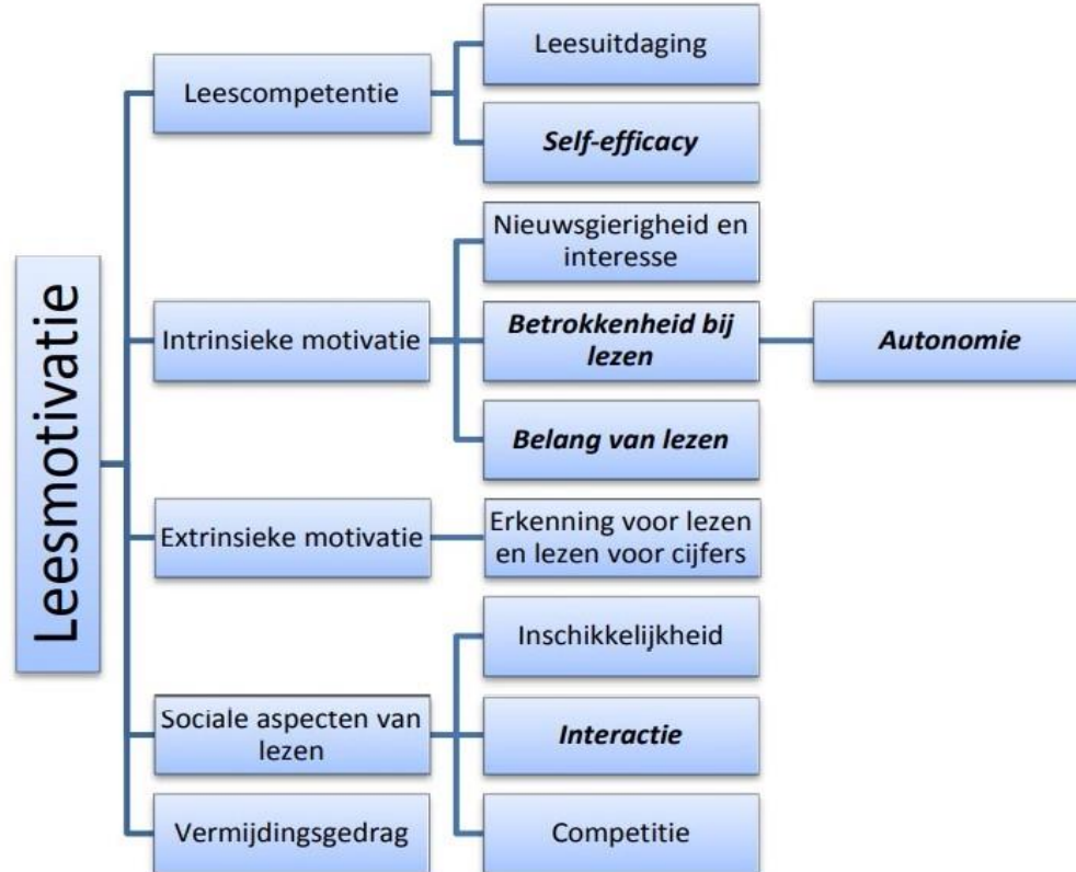
Figuur 3. Model van leesmotivatie met de meest invloedrijke aspecten cursief en vetgedrukt.